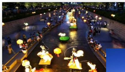
Corée du Sud

Actuel CRIJ Réunion n° 8.26 « Le volontariat international »