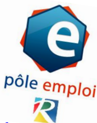
Plate-Forme Oasis 99 Avenue du 20 décembre - BP 154 97824 Le Port Cedex Fax : 0262 55 22 50 Courriel : ale.le-port@pole-emploi.fr