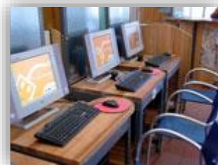
Point Cyb du Nord

28 Rue Jean Chatel 97400 Saint-Denis Tel : 02 62 20 98 22 Fax : 02 62 20 98 21 Web : www.crij-reunion.com Courriel : crij-reunion@crij-reunion.com